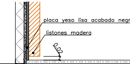
DET - 1

ENCUENTRO CON PAVIMENTO DE LOS LISTONES DE MADERA